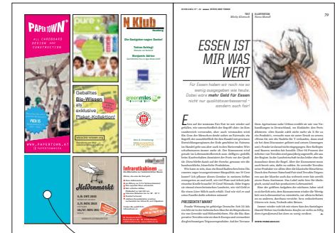
○ Kleinanzeige, 47 × 70 mm