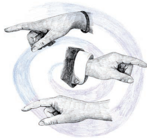
Illustration zur Kolumne »Sintflut« aus BIORAMA 32.

WWW.BIORAMA.EU FACEBOOK.COM/BIORAMA TWITTER.COM/BIORAMA_MAG INSTAGRAM.COM/BIORAMA_MAG